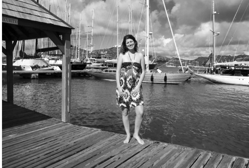
Na zasloužené dovolené v Karibiku

Poté, co jsem si řekla, že být europoslancem je dostatečná výzva, jsem se rozhodla spojit se s lidmi, kteří by mě mohli inspirovat. Bůh ví, proč jsem si sjednala schůzku s (dnes již bývalým) europoslancem Edvardem Kožušníkem, patrně jsem si ho představovala jako milého cestovatele, protože v rámci kampaně se prezentuje jako cyklista projíždějící Evropou. Pozval mě na schůzku, nechal mě vypovídat se a pak mi na rovinu řekl, že nechápe, proč jsem se obrátila zrovna na někoho, kdo by mohl být mým rivalem. A pak se zeptal, kolik mám peněz. Vysvětluje mi, že pro volby je důležité dostat se do povědomí lidí a k tomu mj. slouží billboardy, což stojí peníze. Ale bez nich efektivní kampaň neuděláte. Jinými slovy mi řekl, že jsem asi spadla z višně. Nicméně budiž mu ke cti, že si na mě udělal čas, a samotné setkání bylo zajímavé.