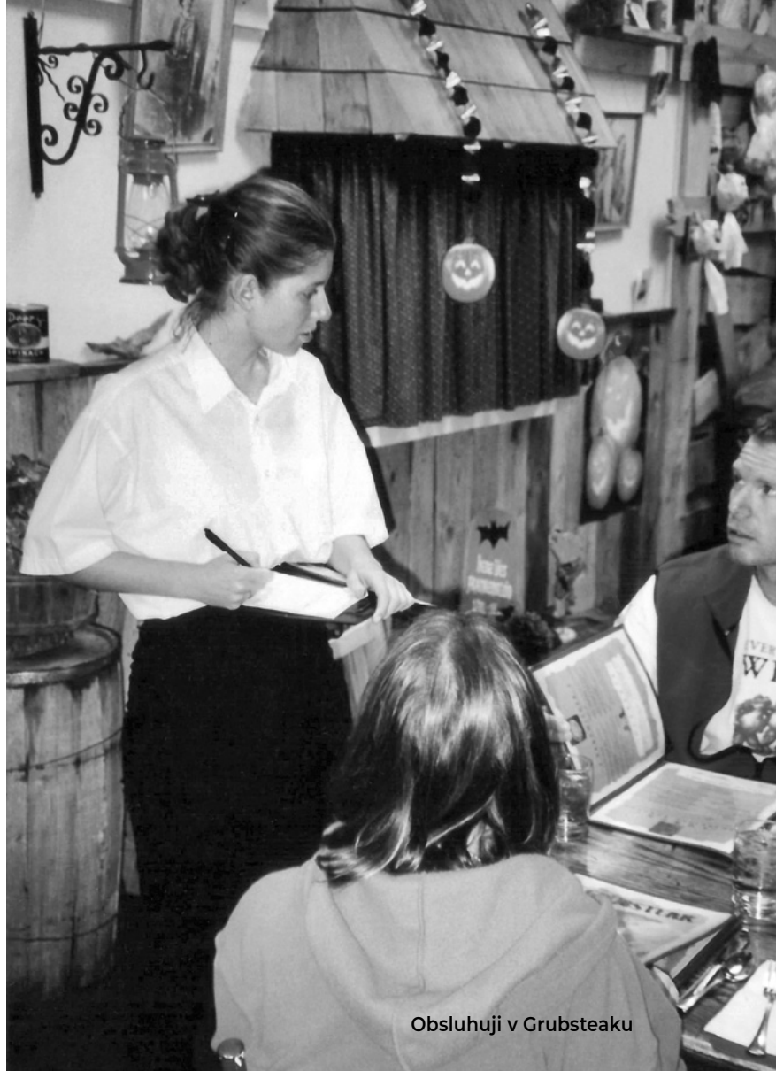
Obsluhuji v Grubsteaku

Servíruju snídaně, je to tam dost nóbl, jsem z toho trochu nervózní. A hlavně praštěná, protože i v Grubsteaku se práce docela rozjíždí, a tam končím v jedenáct večer. V pět ráno si tedy připadám, jako když mě někdo praštil palicí po hlavě. Ještě tak neděle jsou fajn, to jsou brunch. A lidi dávají více dýšek, jinak ani tady nic moc nevydělávám.