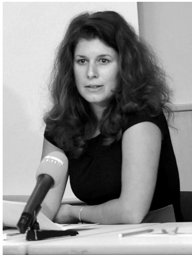
Tisková konference Rekonstrukce státu

Účastním se tiskové konference Rekonstrukce státu ohledně služebního zákona. Zabírá nás i Prima a večer jsme ve zprávách. Kamarádka mi říká: „Mluvila jsi hezky, ale vůbec netuším, o čem to bylo.“ No, bylo to o státní službě. Je to výzva, aby se o právních věcech mluvilo srozumitelně pro všechny. Snažím se o to stále, nelíbí se mi, když právníci zneužívají cizích názvů, aby se cítili lépe. Ale lidé jim pak nerozumí. To samé se mi nelíbí u politiků. Mám ráda jasné vyjadřování bez vedlejších úmyslů. Proto mne také zajímá mediace. Je o komunikaci mezi stranami, která pomůže vyřešit jejich problémy. Také je o hledání spolupráce mezi lidmi. A v politice je tohoto umění třeba jako soli. Je potřeba hledat spolupráci i s lidmi, s kterými si třeba lidsky nesympatizujete, ale je třeba s nimi jednat při prosazování potřebného a užitečného pro občany.