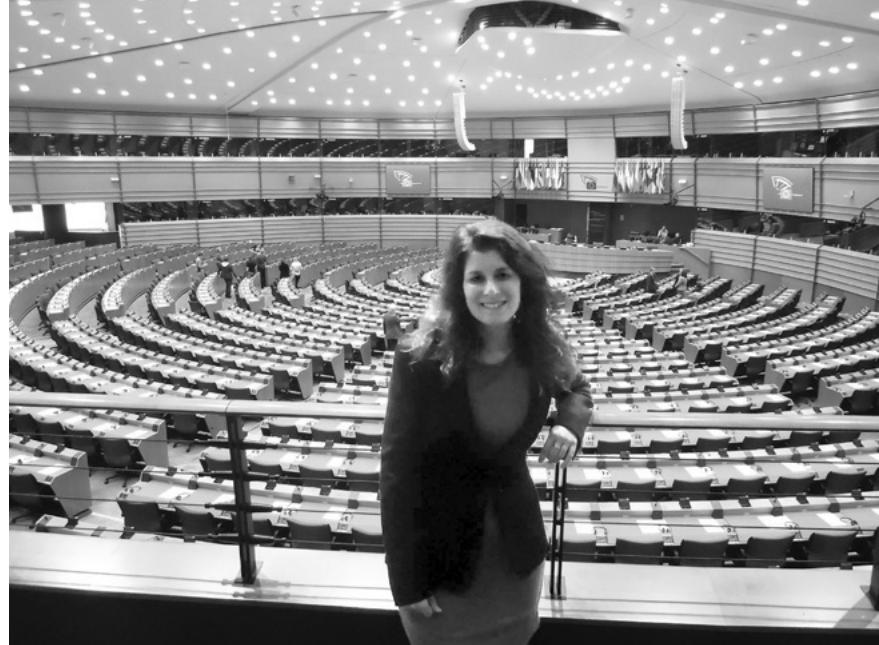
V Evropském parlamentu

Byt je skoro nevybavený, ale má dřevěnou luxusní terasu s krásným výhledem. Spaní je v patře úplně pod střechem. V noci je mi špatně, zvracím a motá se mi hlava. Mám pocit, že ztrácím vědomí. Komu zavolat? Tady mě nikdo nenajde. Volám si záchranku a vrávorám do přizemí jen v košilce a žu-