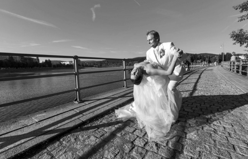
Svatební tanec u jablonecké přehrady